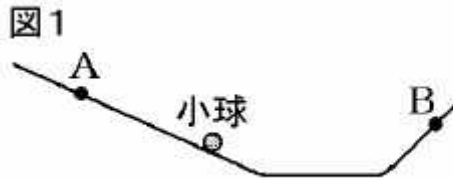
図1のように、斜面上のA点で、小玉を静かにはなしたところ、小玉は斜面をすべり落ち、水平面を移動し、さらに斜面を上がってB点を通る運動をした。図2は、小玉を静かにはなしてからB点を通るまでの、時間と小玉の速さの関係を表したものである。このことに関して、次の問いに答えなさい。ただし、A点からB点までの面と小玉の間には、摩擦力は働かないものとする。